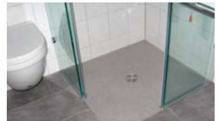
Wearcoat: In Verbindung mit farbigem Quarzsand auch als Oberflächenbelag in Duschen geeignet.

So eignet sich Wearcoat als Beschichtung für alle möglichen zu schützenden oder zu verschönernden Oberflächen. Wearcoat ist, ebenso wie das Sealoflex® System, frei von Lösemitteln und Weichmachern und kommt auch vielfältig in Innenräumen zur Anwendung.