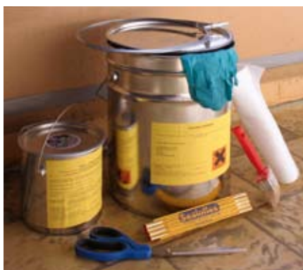
Sealoflex® Express Notabdichtung

Das neue Sealoflex® Express dichtet besonders schnell ab und eignet sich daher gut für